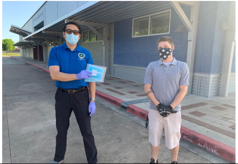
Gene and staff reminding HD 137 socially distance, mask up, and stay safe this holiday season!

Please stay safe this holiday season by wearing your mask, socially distancing, and making sure to get tested for COVID-19 before attending a gathering.