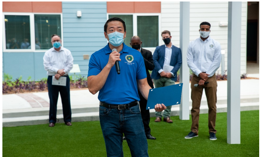
Rep. Wu, masked-up, and speaking at the grand opening of the New Hope Housing development in HD 137. Welcome to our new neighbors!